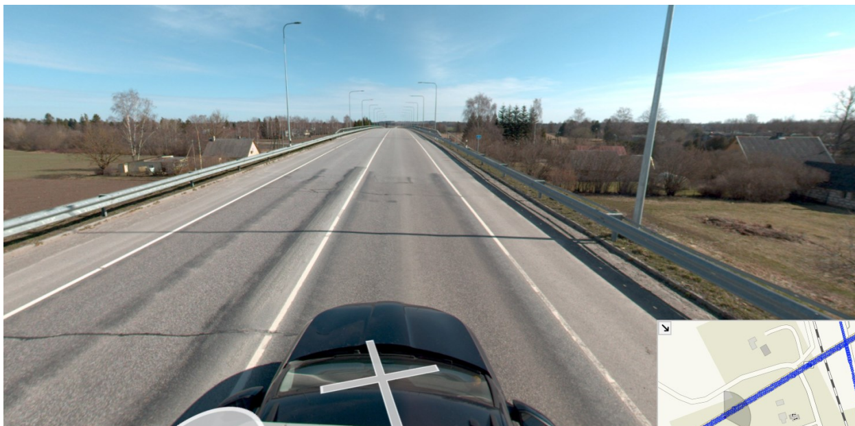
Joonis nr 2. Väljavõtte teevideost km 1,972. Vaade viaduktilt.

Lähtume samadest põhimõttest üle-eestiliselt ning tee kaitsevööndi vähendamisega oleme nõustunud tiheasustusalal kus kiirusrežiim on 50 km/h, rajatud on kergliiklusteed ja hoonestusjoon teekaitsevööndis on välja kujunemas või juba pikemas lõigus välja kujunenud.