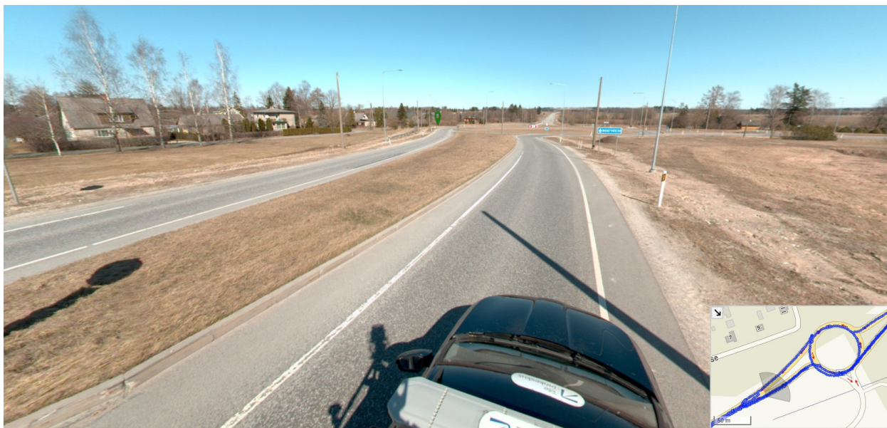
Joonis nr 2. Väljavõtte teevideost km 2,348 ringristmiku lähistelt. Hoonestus teest 40+ m kaugemal.

Riigitee liiklussagedus on 2023 a loendusandmetel 2834 autot ööpäevas. Kiirusrežiim on 70-90 km/h. Tugimaanteel on asulaväline liikluskeskkond, mis ei ole võrreldav linnatänavaga (vt joonis nr 2). Riigitee kaitsevööndis puudub väljakujunenud hoonestusjoon ja hooned paiknevad kohalike Kase ja Lauri tänavate ääres. Ringristmikust tulenev müratase ja ümbruskonna häiringud on arvestatavad (näiteks öösel autotulede valgusvihud, kiirendamine jmt). Lauri tee kinnistutel puudub põhjendus kaitsevööndi vähendamiseks, sest kinnistuid võib senisel otstarbel edasi kasutada.